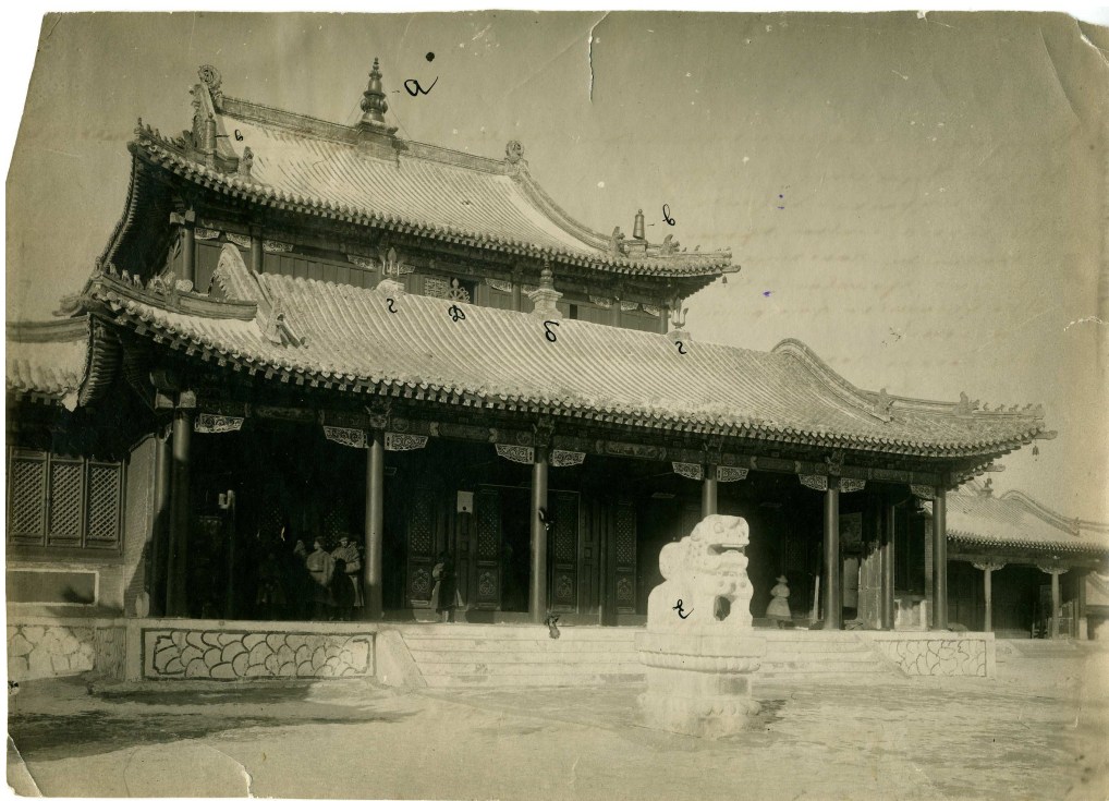
Илл. 1. Наружный вид центрального храма Халхэн-сумэ в княжестве Барун-Узумчин (ТОКМ ФФ 3798-113)

Снимок ФФ 3798-113, «Наружный вид центрального храма в Халхэн-сумэ княжества Барун-Узумчин» (илл. 1) имеет размеры 23,1 x 16,7 см и действительно представляет собой вид на главное храмовое здание комплекса, построенного в китайском стиле.